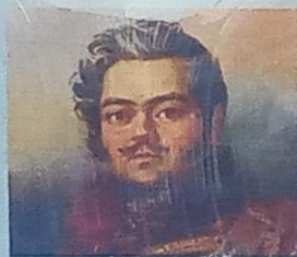
Поэт «Пушкинской плеяды», генерал-лейтенант, партизан. Портрет Дениса Васильевича Давыдова мастерской Джорджа Доу, Военная галерея Зимнего Дворца, Государственный Эрмитаж (Санкт-Петербург)